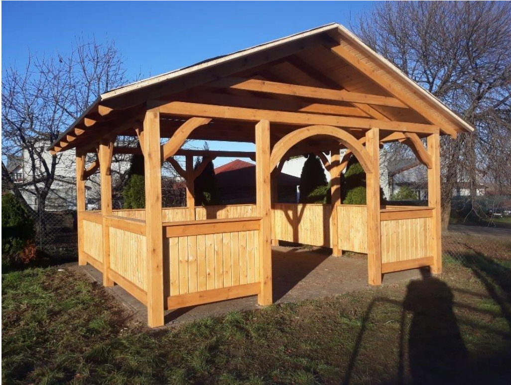
Altana ogrodowa w Węgiercach