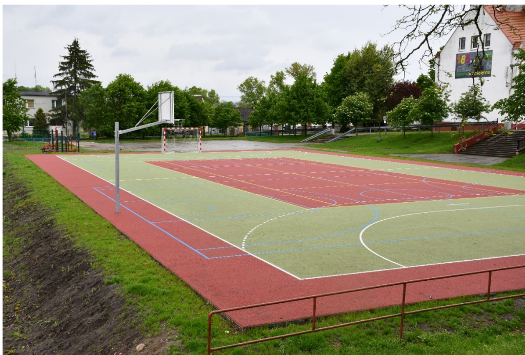
Przebudowane boisko w Kościelcu

- „Przebudowa boiska sportowego na wielofunkcyjne oraz siłowni zewnętrznej w Kościelcu”; zadanie zrealizowane w ramach działania 19.2 Wsparcie na wdrażanie operacji w ramach strategii rozwoju lokalnego kierowanego przez społeczność objętego Programem Rozwoju Obszarów Wiejskich na lata 2014 – 2020; w ogłoszonym przez Stowarzyszenie LGD Czarnoziem na Soli konkursie, projekt ten został wybrany do dofinansowania w wysokości 63,63 % kosztów kwalifikowalnych; koszt realizacji zadania wyniósł 373 547,31 zł, w tym dofinansowanie ze środków Unii Europejskiej w kwocie 234 794,00 zł. ; w ramach zadania dokonano przebudowy boiska asfaltowego, w wyniku czego powstało boisko o nawierzchni syntetycznej do gry w piłkę ręczną, piłkę siatkową, piłkę koszykową oraz boisko do gry w tenisa ziemnego; ponadto dokonano relokacji siłowni zewnętrznej,