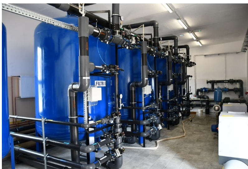
Zmodernizowana stacja uzdatniania wody przy ul. Jankowskiej w Pakości