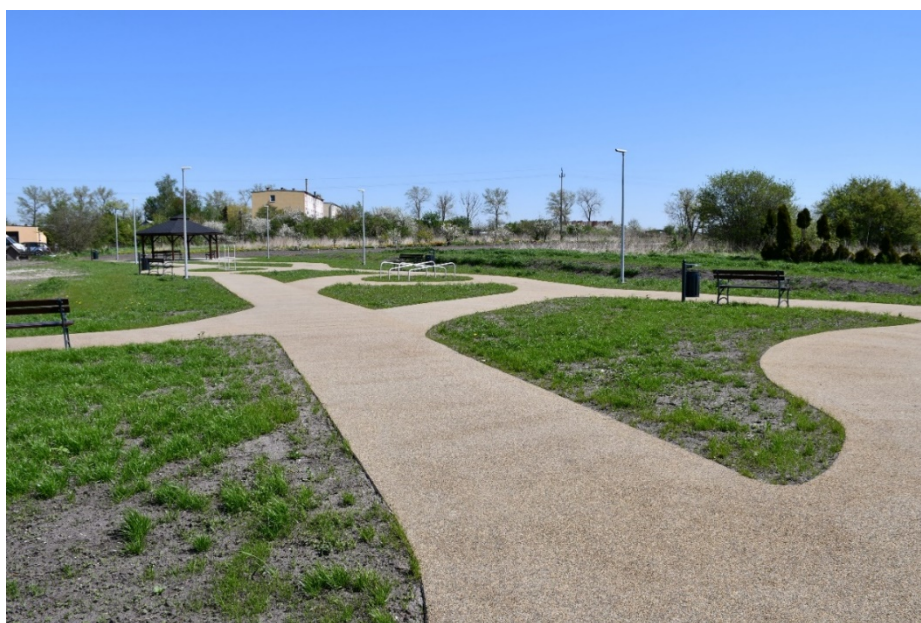
Ścieżka rekreacyjna w Dziarnowie