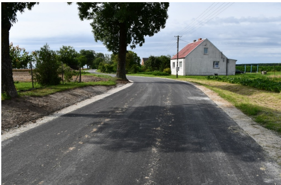
Droga w Ludwińcu

- „Przebudowa drogi gminnej nr 150434C Ludwiniec – Dobieszewiczki”; koszt realizacji zadania to: 230 395,95 zł; w ramach zadania wykonano nawierzchnię bitumiczną drogi, realizowaną dwuwarstwowo, składającą się z warstwy wiążącej i ścieralnej, o minimalnej łącznej grubości warstw 7 cm, wykonaną od podstaw tj. na istniejącej nawierzchni gruntowej; na realizację zadania uzyskano dofinansowanie w wysokości 81 000,00 zł ze środków przeznaczonych w budżecie Województwa Kujawsko – Pomorskiego na modernizacji dróg dojazdowych do gruntów rolnych,