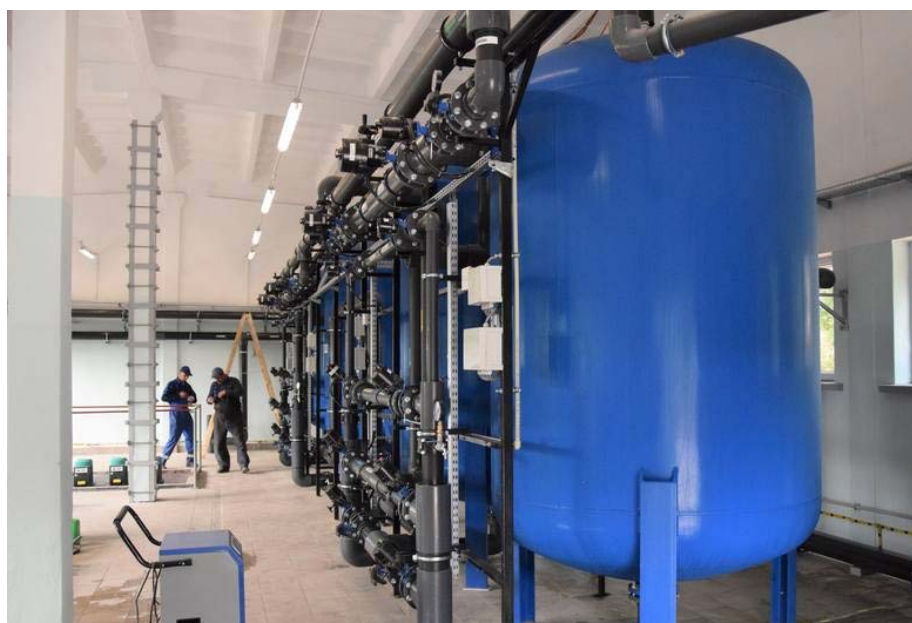
Zmodernizowana stacja uzdatniania wody w Kościelcu