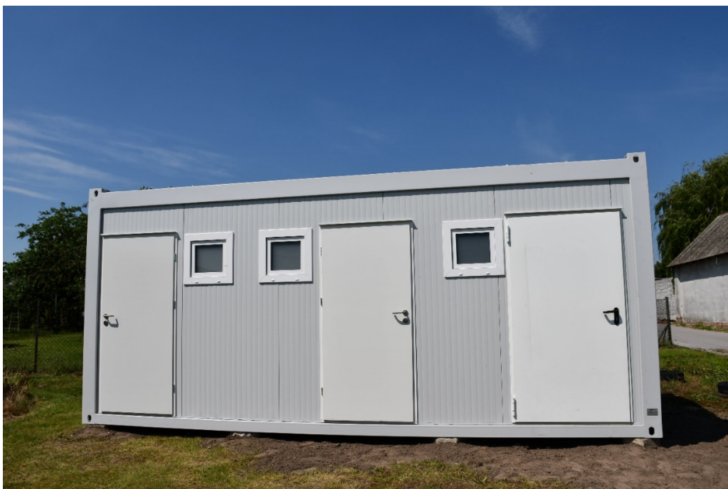
Kontener sanitarny w Jankowie