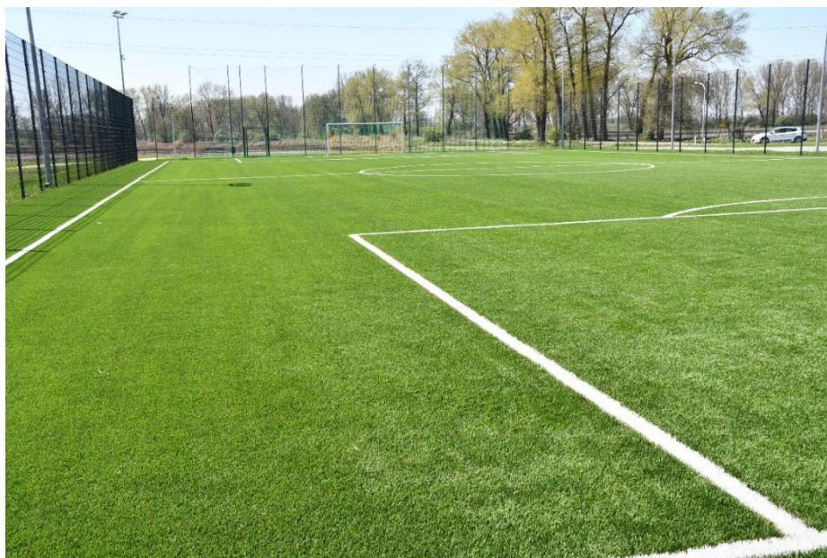
Boisko w Dziarnowie.

W 2020r. zrealizowano roboty budowlane w 80%.