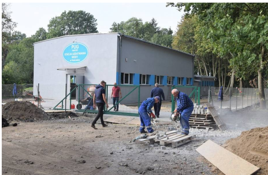
Remont budynku stacji uzdatniania wody w Kościelcu

- przeprowadzenie modernizacji stacji uzdatniania wody w Kościelcu - w ramach prowadzonych prac wymieniono wszystkie instalacje technologiczne na nowe; zastosowany układ technologiczny składa się z dwustopniowego napowietrzania i dwustopniowej filtracji wody i jest w pełni zautomatyzowany; w ramach zadania przeprowadzono również kapitalny remont budynku oraz uporządkowano tereny wokół niego; zadanie zrealizowane zostało przez Przedsiębiorstwo Usług Gminnych Sp.z. o.o. w Pakości,