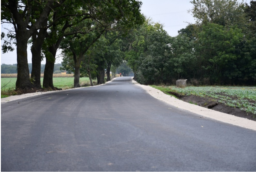
Droga w Kościelcu

- „Przebudowa drogi gminnej nr 150426C Kościelec – Węgierce”; koszt realizacji zadania to: 1 229 540,00 zł; w ramach zadania wykonano jezdnię o nawierzchni bitumicznej szerokości 5 m z obustronnymi poboczami utwardzonymi kruszywem łamanym na szerokości 0,75 m oraz zjazdami w granicach pasa drogowego; zadanie uzyskało dofinansowanie ze środków rządowego Funduszu Dróg Samorządowych w kwocie 666 412,00 zł , co stanowi 55% kosztów kwalifikowalnych zadania,