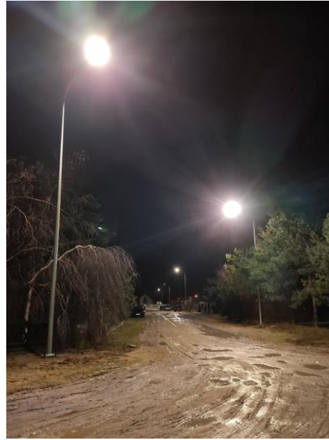
Zmodernizowane oświetlenie przy ul. Szenica i ul. Ks. J. Kurzawskiego