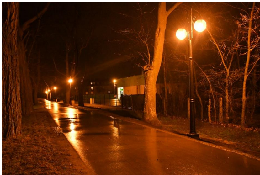
Słupy oświetleniowe przy Przedszkolu Miejskim

- „ Zagospodarowanie terenu osiedla ul. Działyńskich w Pakości oraz ulic przyległych ”; Na realizację inwestycji Gmina Pakość uzyskała promesę wstępną dotyczącą jej dofinansowania z programu Rządowy Fundusz Polski Ład: Program Inwestycji Strategicznych w kwocie 7.505.000,00 zł. Zostało przeprowadzone postępowanie przetargowe, wyłoniono wykonawcę oraz zrealizowano roboty budowlane polegające na przebudowie istniejącego oświetlenia (ul. Stanisława Szenica; Ks. Józefa Kurzawskiego)/ budowie nowego oświetlenia (ul. Mieleńska/ Ludkowo). W ramach zadania ustawiono 19 szt. słupów oświetleniowych z oprawami oświetleniowymi LED.