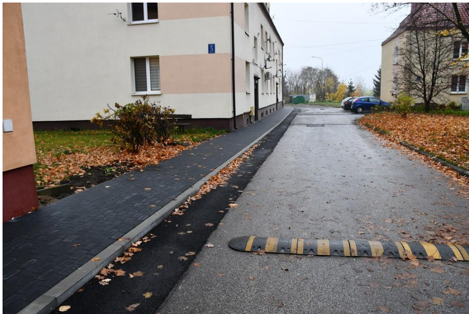
Zagospodarowanie terenu wokół wspólnot przy ul. Fabrycznej

- „Zagospodarowanie terenu wokół wspólnot przy ul. Fabrycznej” koszt realizacji zadania to: 88 777,82 zł; w ramach zadania wykonano przebudowę chodników z kostki brukowej betonowej o grubości 6 cm na podsypce cementowo – piaskowej gr. 3 cm i podkładzie z piasku zagęszczonego. Krawężniki betonowe oparte na podsypce i ławie betonowej.