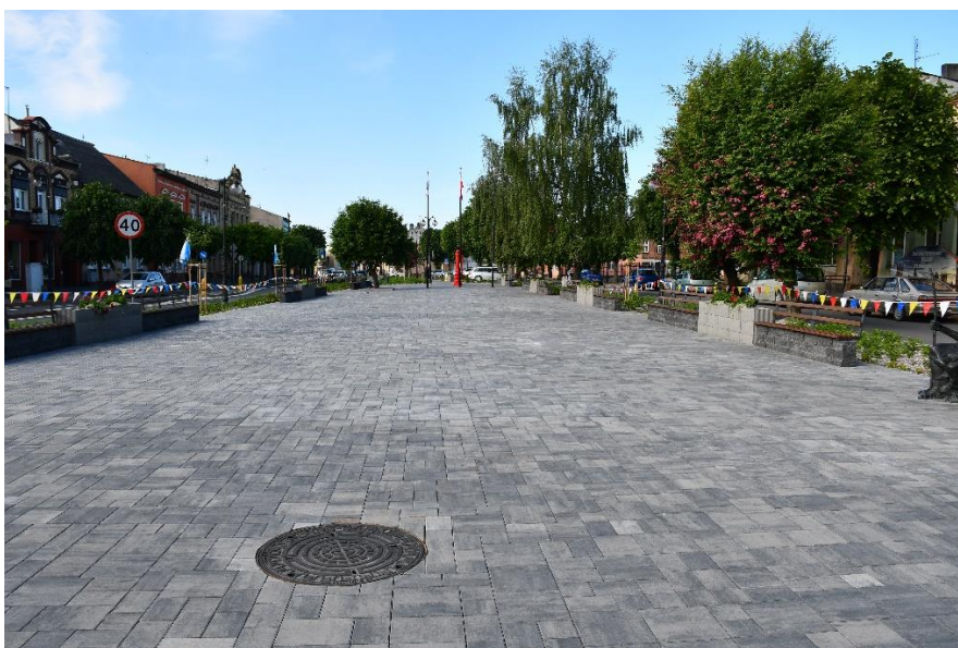
Rynek miejski w Pakości

Na realizację przedmiotowego zadania uzyskano dofinansowanie w ramach działania 6.2. Rewitalizacja obszarów miejskich i ich obszarów funkcjonalnych.