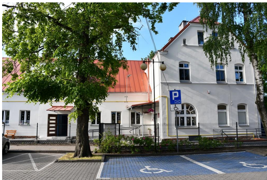
Adaptacja budynku po Przedszkolu Publicznym w Pakości na potrzeby seniorów

- „ Adaptacja budynku po Przedszkolu Publicznym w Pakości na potrzeby seniorów ”; Rozpoczęto wymianę poszycia dachowego, remontu elewacji, remontu kotłowni z wymianą kominów, remont i częściową wymianę ogrodzenia, wymianę stolarki okiennej, częściowa przebudowę instalacji wodno – kanalizacyjnej i elektrycznej. Na realizację przedmiotowego zadania uzyskano dofinansowanie w ramach działania 6.2. Rewitalizacja obszarów miejskich i ich obszarów funkcjonalnych.