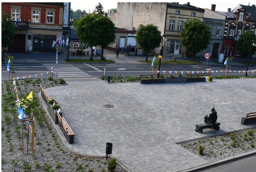
Rynek miejski w Pakości

- „ Adaptacja budynku po Przedszkolu Publicznym w Pakości na potrzeby seniorów ”; Rozpoczęto wymianę poszycia dachowego, remontu elewacji, remontu kotłowni z wymianą kominów, remont i częściową wymianę ogrodzenia, wymianę stolarki okiennej, częściowa przebudowę instalacji wodno – kanalizacyjnej i elektrycznej. Na realizację przedmiotowego zadania uzyskano dofinansowanie w ramach działania 6.2. Rewitalizacja obszarów miejskich i ich obszarów funkcjonalnych.