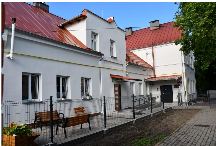
Dom dziennego pobytu dla seniorów

- uzyskanie dofinansowania w ramach realizacji ministerialnego Programu Wieloletniego „Senior+ na lata 2015-2020”, moduł II „Zapewnienie funkcjonowania Dziennego Domu Senior+” w kwocie 71 258,71 zł ; głównym celem było objęcie wsparciem 25 seniorów i zrealizowanie na ich rzecz usług w zakresie socjalnym i edukacyjnym; w ramach zadania placówka Domu dziennego pobytu dla seniorów została wyposażona w stoły i ławki ogrodowe, grill ogrodowy, a na potrzeby terapii zajęciowej zakupiono materiały i wyposażenia, w tym m.in. tablicę magnetyczną suchocierną, drobny sprzęt AGD, środki czystości; opłacone zostały koszty związane z bieżącą działalnością Domu; projekt zrealizowany przez Ośrodek Pomocy Społecznej w Pakości,