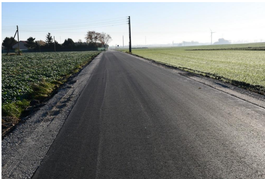
Przebudowa drogi gminnej nr 150452C Wielowieś – Wiatrak

- „ Przebudowa drogi gminnej nr 150452C Wielowieś – Wiatrak ”, koszt realizacji zadania to: 271 364,16 zł; w ramach zadania wykonano jezdnię z nawierzchni bitumicznej (warstwa ścieralna i wiążąca gr. do 7 cm, pobocze z kruszywa łamanego). Odwodnienie powierzchniowe wykonane zostało za pomocą spadków poprzecznych wraz z wykonaniem poboczy i zjazdów na posesje; na realizację zadania uzyskano dofinansowanie w wysokości 126 000,00 zł ze środków przeznaczonych w budżecie Województwa Kujawsko – Pomorskiego na modernizacji dróg dojazdowych do gruntów rolnych.