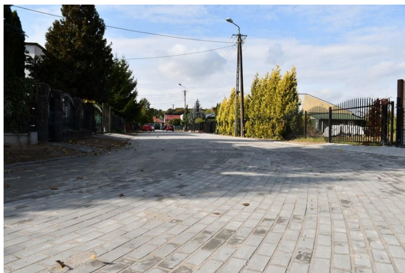
Przebudowa drogi gminnej nr 151819C - ul. Wyszyńskiego

- „ Przebudowa drogi gminnej nr 151819C - ul. Wyszyńskiego ”; koszt realizacji zadania to: 358 000,00 zł; w ramach zadania wykonano nawierzchnię z kostki brukowej betonowej o długości 0,295 km. Konstrukcja zjazdów do posesji taka sama jak w ciągu głównym. Zaprojektowano studzienki ściekowe z wpustami żeliwnymi. Jezdnia na ciągu głównym i zjazdach obramowana obrzeżem betonowym na ławie betonowej.