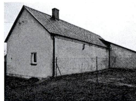
Dom od strony południowo-zachodniej