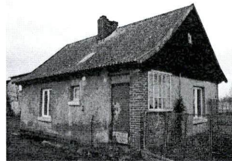
Dom od strony południowo-wschodniej