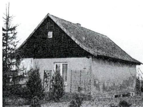
Dom od strony północno-wschodniej