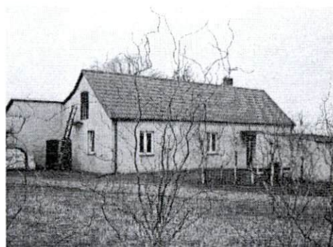
Dom od strony północno-wschodniej