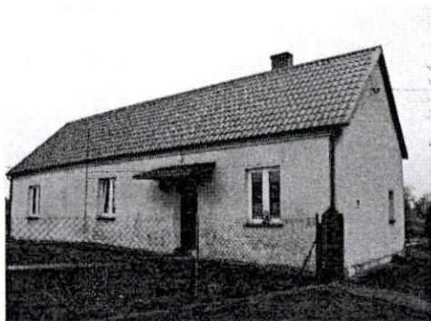
Dom od strony północno-zachodniej

8. Fotografia z opisem wskazującym orientację albo mapa z zaznaczonym stanowiskiem archeologicznym