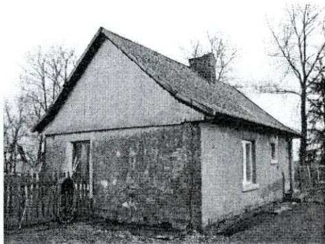
Dom od strony południowo-zachodniej

8. Fotografia z opisem wskazującym orientację albo mapa z zaznaczonym stanowiskiem archeologicznym