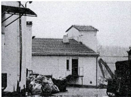
Rakarnia od strony północno-wschodniej

8. Fotografia z opisem wskazującym orientację albo mapa z zaznaczonym stanowiskiem archeologicznym